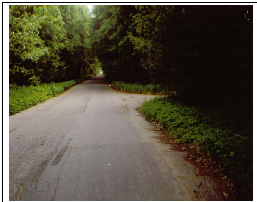
Fragment odcinka ulicy mjr.pilota Jana Michałowskiego.