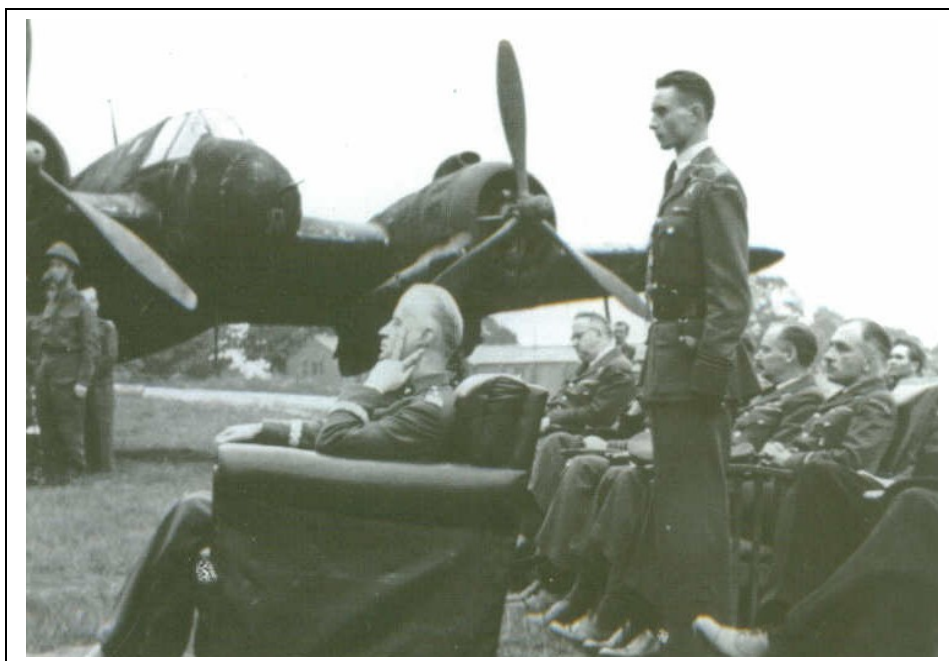
Gen. Władysław Sikorski w dniu Święta Dywizjonu 10 września 1942 r. w Exeter. W głębi samolot „Bristol Beaufighter” – dowódcy 307. Dywizjonu Myśliwskiego Nocnego mjr. pilota Jana Michałowskiego, który oczekuje na start powrotny Naczelnego Wodza do Londynu.